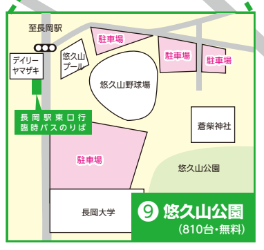
9 悠久山公園 (810台・無料)