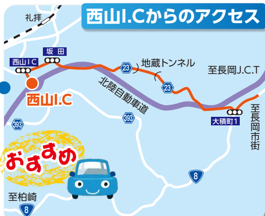
西山I.C.からのアクセス